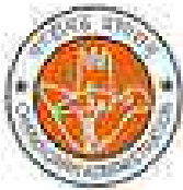
चंडीगढ़ का प्रतीक