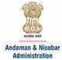
अंडमान और निकोबार द्वीपों का प्रतीक