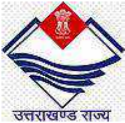
उत्तराखण्ड का प्रतीक