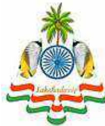
लक्षद्वीप का प्रतीक